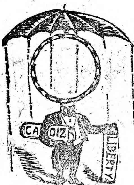
Dr ARO Profesor de Goteras